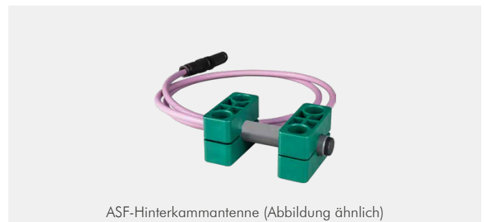
ASF-Hinterkammantenne (Abbildung ähnlich)

Die Hinterkammantenne lässt sich perfekt an der Kammschüttung montieren und ist somit ideal geeignet, wenn die Installation einer Zahnantenne nicht möglich ist. Durch den Einsatz der Hinterkammantenne lassen sich sowohl an Heckladern als auch an Seitenladern unterschiedliche Behältergrößen anhängen und auslesen.