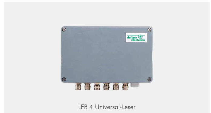
LFR 4 Universal-Leser

Der LFR 4 liest Entsorgungsbehälter mit HDX- und FDX-Transpondern und identifiziert dabei Transpondernummern und Kennungen der Antenne. Erfasste Daten werden an Tablets oder den Bordrechner übergeben. Die Autotrimmfunktion sorgt für eine schnelle Installation und sofortige Systembereitschaft. Bei Bedarf können bis zu 4 Antennen angeschlossen werden. Durch die Autotrimmfunktion können verschiedene Zahn- und Bodyantennen auch gemischt eingesetzt werden.