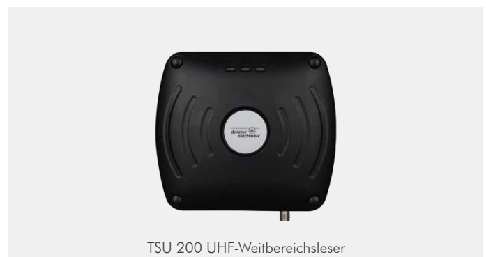
TSU 200 UHF-Weitbereichsleser

Die TSU Lesegeräte überzeugen durch ihr extrem robustes Aluminium-Druckguss Gehäuse mit kompakter Bauform. Leser und Antenne sind in einem Gehäuse verbaut und werksseitig optimal aufeinander abgestimmt. Damit ist eine verlässliche Einstellung der Leseleistung möglich! Der TSU 200 erzielt eine Reichweite von bis zu 7 m. Der Betriebszustand wird über die gut sichtbare LED-Anzeige signalisiert. Alle Anschlüsse am Leser sind als M12 Steckverbinder ausgeführt.